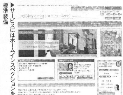
▶サービスにはホームインスペクションを標準装備